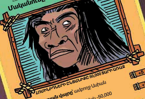
ՀՈՄԻՆՈՆԵՐԻ ԸՆՏՆՆԵՐԸ 50,000 ՏԱՐԻ ԱՌԱՋ