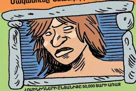
ՀՈՄԻՆՈՆԵՐԻ ԸՆՏՆՆԵՐԸ 50,000 ՏԱՐԻ ԱՌԱՋ