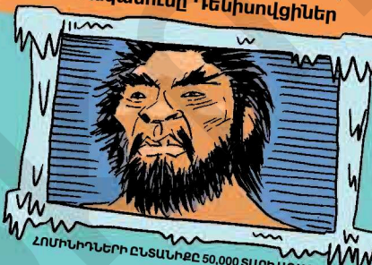
ՀՈՄԻՆՈՆԵՐԻ ԸՆՏՆՆԵՐԸ 50,000 ՏԱՐԻ ԱՌԱՋ