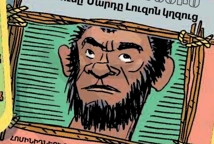
ՀՈՄԻՆՈՆԵՐԻ ԸՆՏՆՆԵՐԸ 50,000 ՏԱՐԻ ԱՌԱՋ