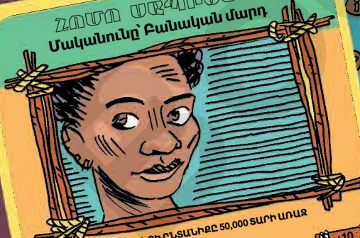
ՀՈՄԻՆՈՆԵՐԻ ԸՆՏՆՆԵՐԸ 50,000 ՏԱՐԻ ԱՌԱՋ