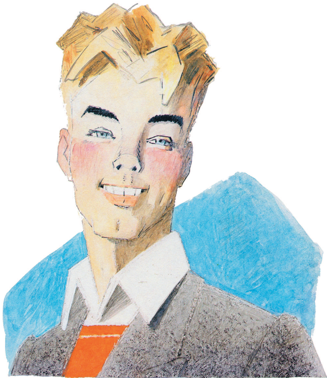
Рисунки Ю. Коровина